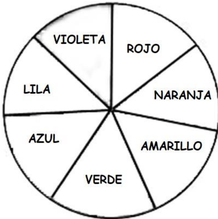
DISCO DE NEWTON (RELLENAR CON LOS COLORES INDICADOS)